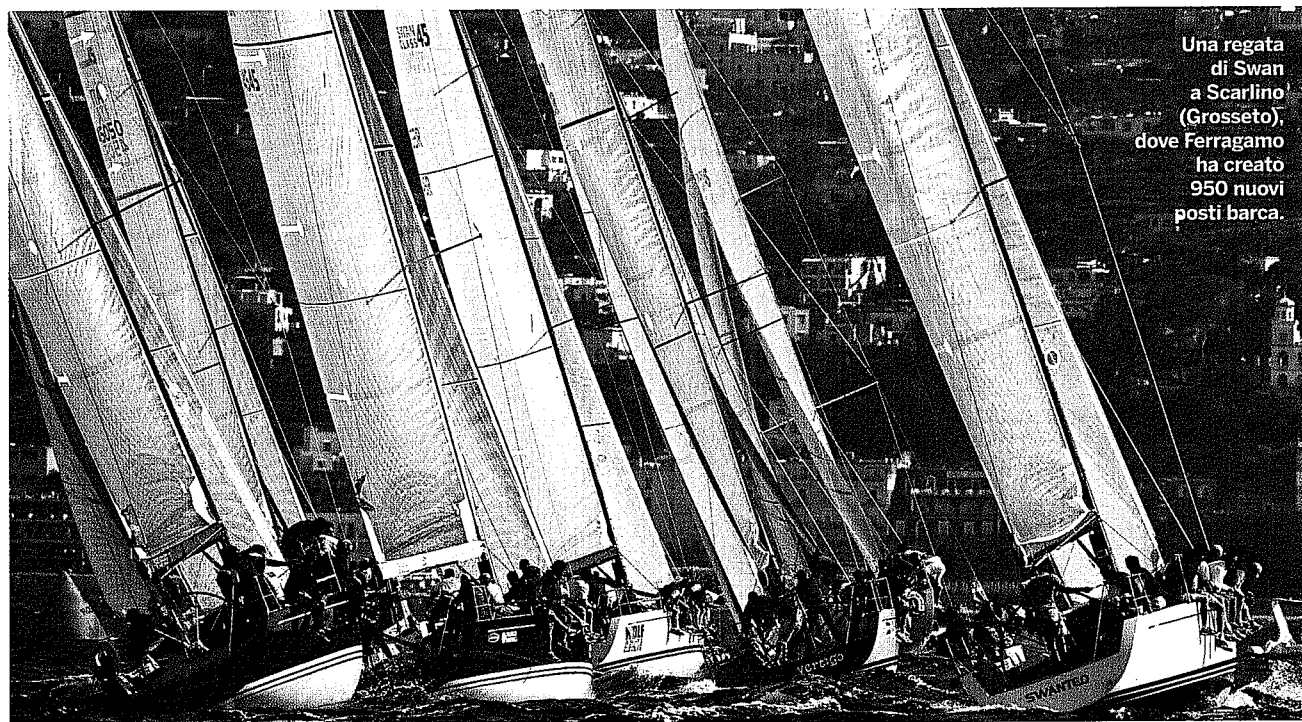
Una regata di Swan a Scarlino (Grosseto), dove Ferragamo ha creato 950 nuovi posti barca.