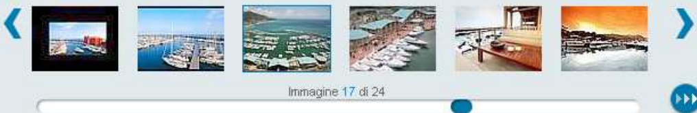
Immagine 17 di 24