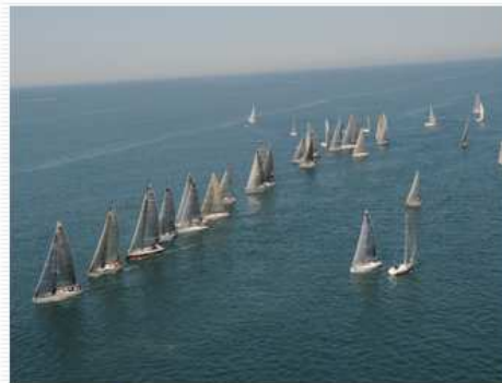
Le regate d'altura.