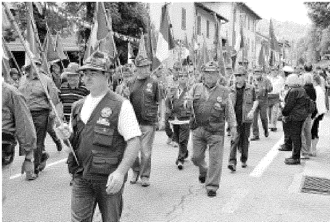
Raduno Alpini di Imperia