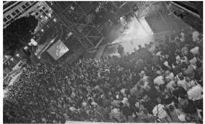
Grande Ferragosto di Savona