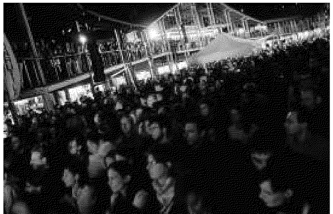
Marina di Varazze