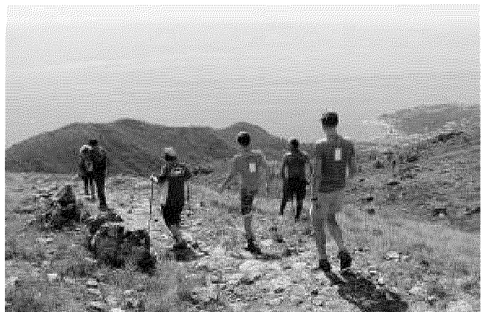
Mare e Monti Arenzano